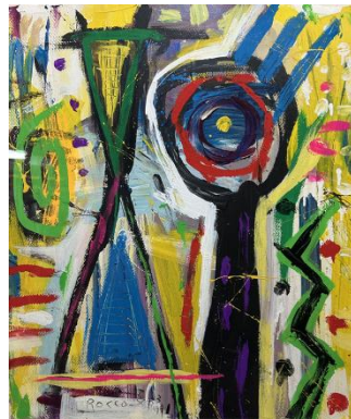
2025年ビジュアル ロコサトシ《砂時計》

そのなかでも今回は、10月11日(土)に横浜赤レンガ倉庫1号館3階ホールで開催される横浜ジャズ100年特別企画「台湾・スペシャルステージ」をご紹介します。