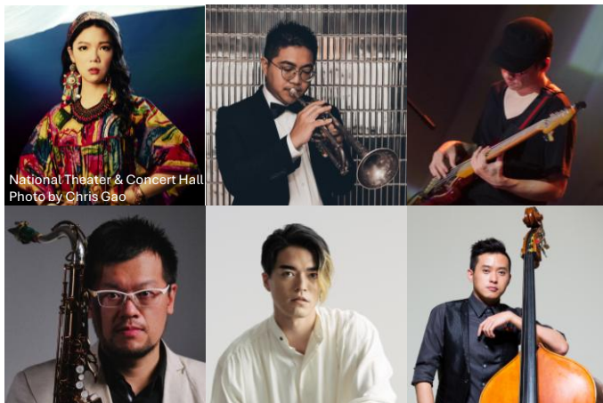
ユーイン・シュー ElektriKKKK 5