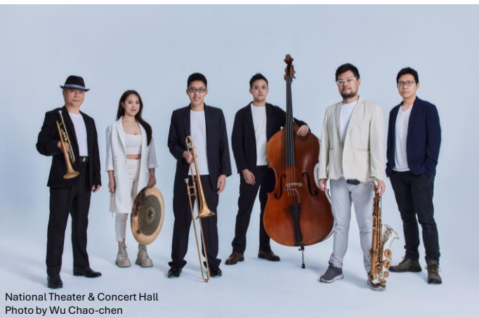
Jazz Awakening! - Taiwan Spirit